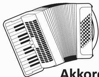
Akkordeon Klavier Keyboard