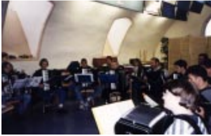
Probenwochenende 1999 in Zwingenberg

Neben diesen musikalischen Aktivitäten gab es jedes Jahr noch Vereinsausflüge, Grillfeste, Weihnachtsfeiern und Probenwochenenden. Auch veranstaltete der Verein seit 1993 jedes Jahr ein Muttertagskonzert, bei dem hauptsächlich die Schüler und kleinere Gruppen die musikalische Gestaltung übernahmen. Die Vereinszeitschrift „Die Quietschvergnügte Quetsche“ gab in den Jahren 1990 bis 1995 das Vereinsgeschehen wieder, mußte jedoch aufgrund von Zeit- und Artikelmangel eingestellt werden.