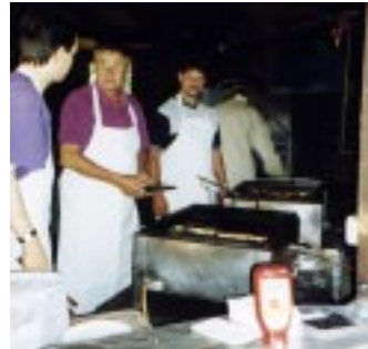
Grillfest 1999 am Braunschardter Tännchen

Immer wieder werden die Akkordeonfreunde auch von den Ortsvereinen gerne zur musikalischen Unterhaltung ihrer Festlichkeiten herangezogen.