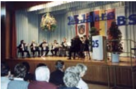
Jubiläumsfeier der Behindertensportgemeinde

Neben diesen musikalischen Aktivitäten gab es jedes Jahr noch Vereinsausflüge, Grillfeste, Weihnachtsfeiern und Probenwochenenden. Auch veranstaltete der Verein seit 1993 jedes Jahr ein Muttertagskonzert, bei dem hauptsächlich die Schüler und kleinere Gruppen die musikalische Gestaltung übernahmen. Die Vereinszeitschrift „Die Quietschvergnügte Quetsche“ gab in den Jahren 1990 bis 1995 das Vereinsgeschehen wieder, mußte jedoch aufgrund von Zeit- und Artikelmangel eingestellt werden.